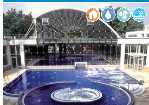
MINERALBAD BAD CANNSTADT